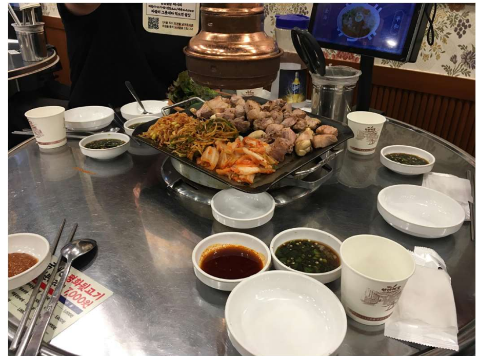
サムギョプサル 航空大学の学生が焼いてくれ感動しました！